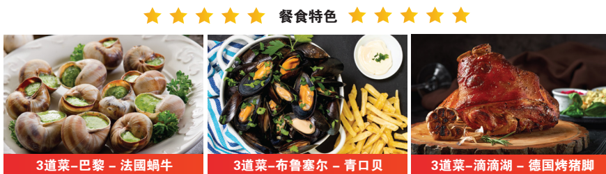
3道菜-巴黎-法国蜗牛