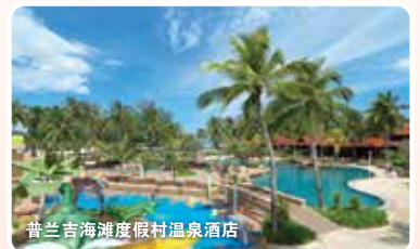
普兰吉海滩度假村温泉酒店